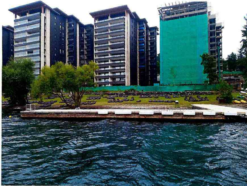
Figura 1: Ocupación de ribera por Parque Pinares no considerada en el proyecto inicial, permisos obtenidos posteriormente por DIRECTEMAR, evidencia la modificación y pérdida de ecosistema irremediable, como la pérdida del valor paisajístico en zona ZOIT.