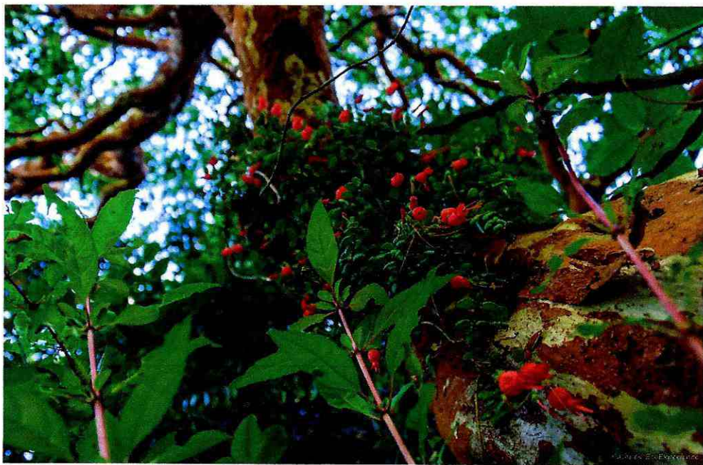
Figura 4: Añoso arrayán ( Luma apiculata ), en simbiosis con epífita medallita ( Sarmienta repens ), acompañados de Chilco ( Fuchsia magellanica ) evidenciando las características del Humedal Las Pitras con Bosque añoso y diverso, acompañado de sotobosque garantizando servicios ecosistémicos en sus tres categorías.

encuentra resguardo en este humedal durante todo el año, siendo en invierno zona segura ante las condiciones climáticas que se prolongan por entre 8 a 10 meses, y en primavera verano les ofrece resguardo ante la ocupación de las aguas y riberas de toda la zona lacustre por veraneantes y vehículos acuáticos motorizados. Estas condiciones mantienen en constante presión a las comunidades de aves como garzas, gaviotas, pidén, huairavos, patos de pico azul, taguas, entre otras que habitan el sector en sus procesos de desarrollo, alimentación y reproducción, de igual manera sucede con mamíferos como el coipo, reptiles y anfibios del lugar. (Figura 4, 5 y 6)