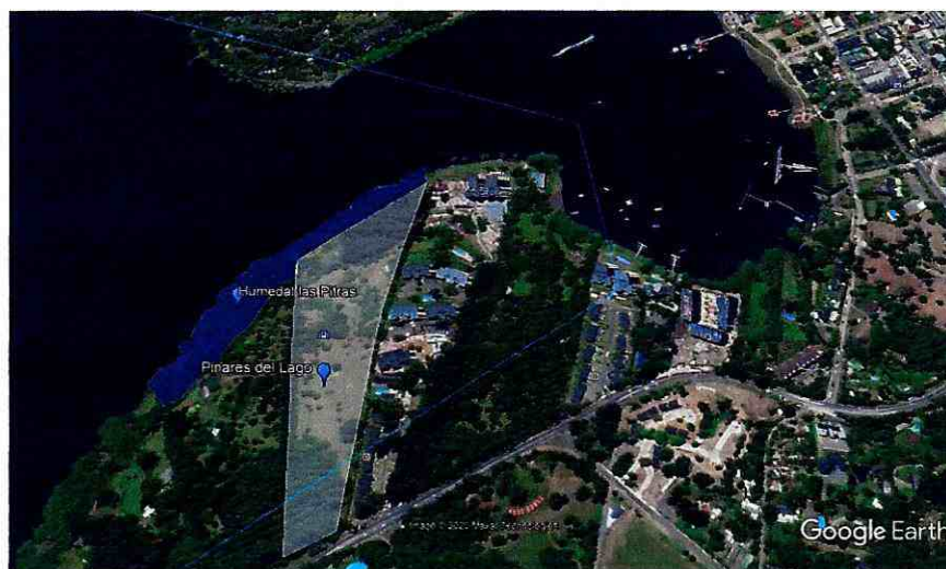
Figura 3. Blanco: Parque Pinares del Lago entre Lago Villarrica y ruta CH-199 , Azul, Humedal las Pitras, superficie 2,2 Ha, longitud 429 m, sector La Poza, Pucón.

El Humedal Las Pitras, como hemos denominado, al humedal urbano, el cual cumple todas las características que aborda el artículo 1º de la recién publicada “Ley de Humedales Urbanos” (Ley 21.202) que busca proteger estos espacios, a través del artículo 2º, “..resguardo de sus características ecológicas y funcionamiento y de mantener su régimen hidrológico, tanto superficial como subterráneo.” se vería afectado por el proyecto. Tiene una superficie de 2,2 Ha, longitud de 429 metros, ubicados en el sur oeste del humedal la poza, siendo este una de las fracciones del humedal La Poza que quedan con su estructura natural entre un 50% - 80%. (Figura 3)