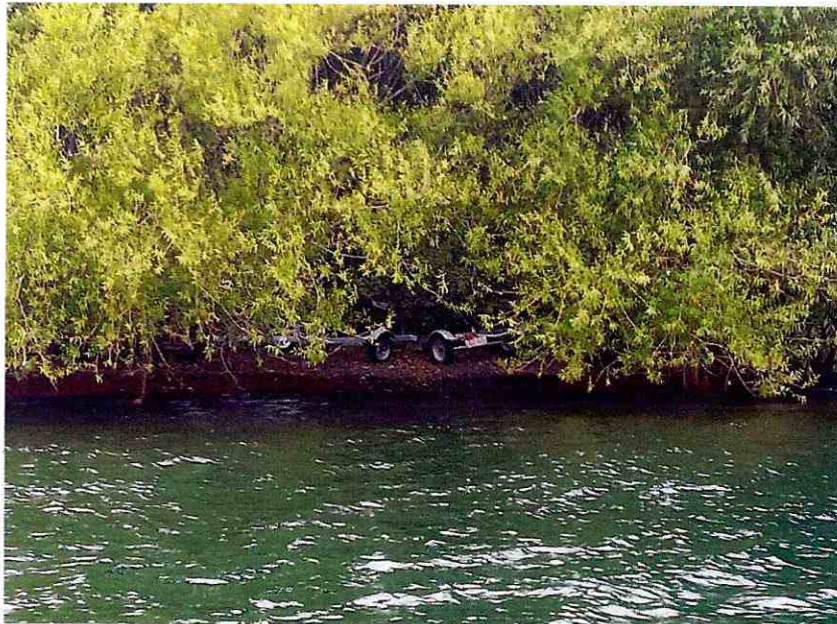
Figura 2: Zona de ribera ocupada como estacionamiento de carros de lancha, en esta zona la Fundación a registrado nidos de taguas, en toda la ribera del lago se repite vegetación exótica (sauce) como límite entre el ambiente terrestre y acuático, superada esta barrera existen remanentes de bosque nativo.