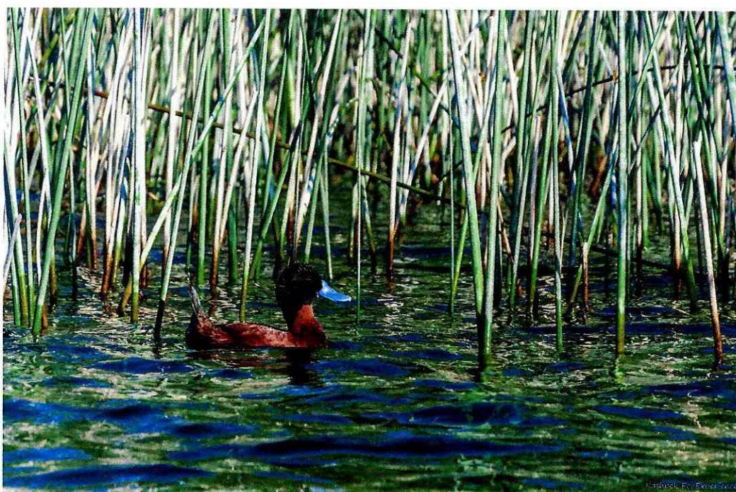
Figura 6: Pato de pico azul o zambullidor ( Oxyura ferruginea ), una de las aves más vistosas del lugar, esta temporada no hubo aumento de los 7 individuos monitoreados por la Fundación.