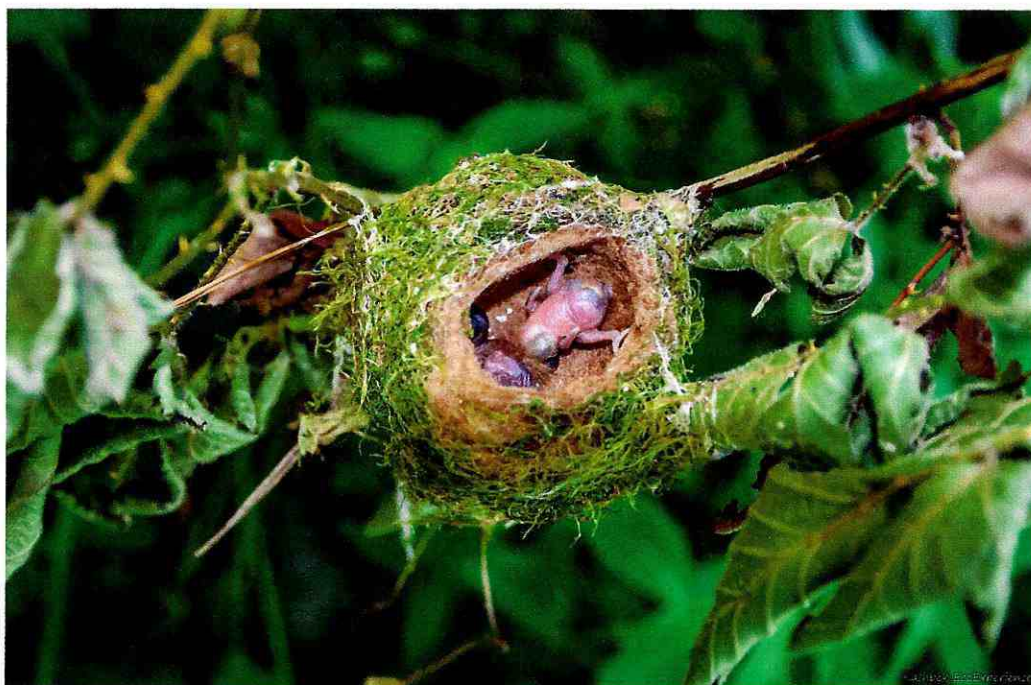
Figura 5: Nido de colibrí ( Sephanoides sephanoides ) con dos pichones fotografiados en Humedal las Pitras a fines de diciembre del año 2019 evidencian la importancia de este reducido espacio natural en la ribera del Lago Villarrica