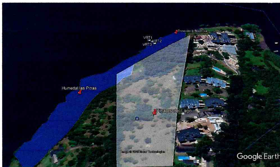
Figura 8: Se visualiza tres puntos georeferenciados de vertiente en área de influencia del proyecto, ubicado en Humedal las Pitras.

Existe una vertiente permanente en el sector bajo el proyecto Pinares del Lago, que ha sido georeferenciada con equipo Garmin (GPSMAP 64x) cuyas coordenadas son 242322.71 m E, 5648000.65 m S, Huso 19 (figura 8)